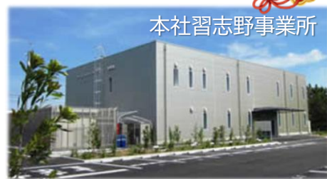
本社習志野事業所